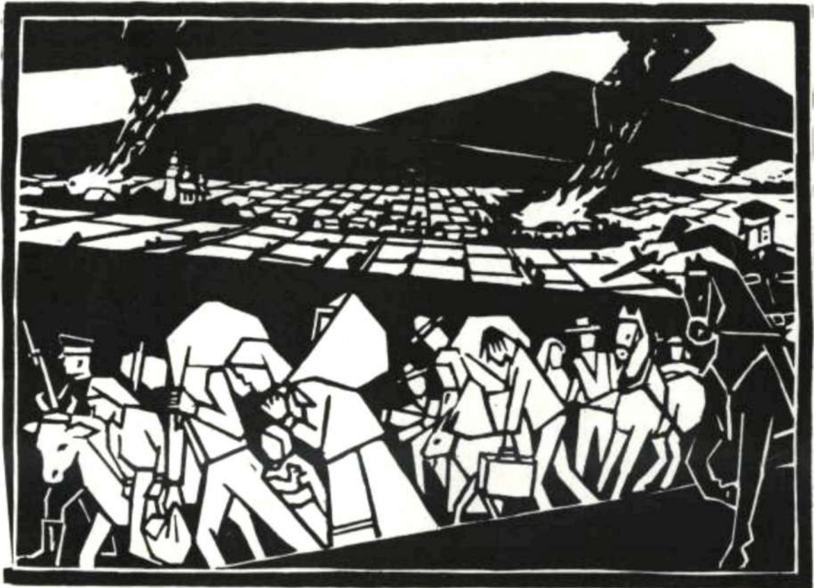
Гравюра Василя Мадзеляна "Операція Вісла".